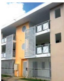
JUILLET 2015 27 logements livrés à la résidence René Durimel aux Abymes

S'il est vrai que cette élection est une obligation légale, la SEMAG, soucieuse d'améliorer ses relations avec ses locataires, en fait un vrai enjeu dans sa relation client. Le témoignage de nos représentants montre clairement la volonté affirmée de la SEMAG de donner toute sa place aux élus des locataires dans l'accomplissement de leurs missions.