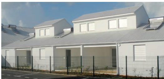
MAI 2015 25 logements intermédiaires (PLS) livrés dans le quartier de Trioncelle à Baie-Mahault.